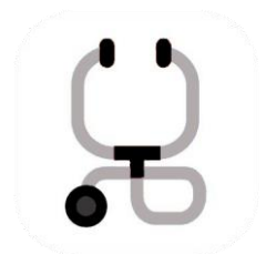
Ir al médico si tengo algunos de los síntomas anteriores