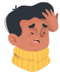
Dolor de cabeza y cansancio