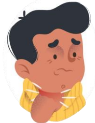
Dolor de garganta y de pecho