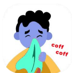
Toser y estornudar cubriéndome la boca con un pañuelo desechable